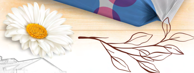
Салфетки влажные гигиенические Greenelle «Baby Cream Camomile»

Срок годности 2 года с даты изготовления.