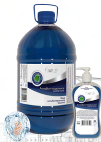
Мыло жидкое для мытья рук «Солнечная дыня»