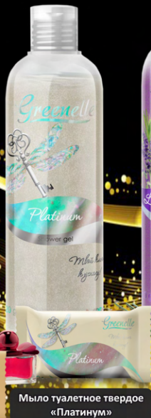
Мыло туалетное твердое «Платинум»

Срок годности 2 года с даты изготовления.