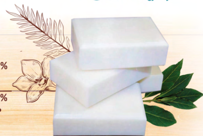
Мыло хозяйственное твердое 65% «Хозяюшка» морозное утро с энзимами для стирки и удаления пятен