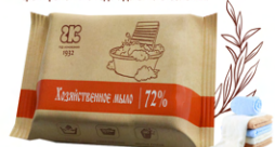
Мыло хозяйственное твердое 72%

Срок хранения 3 года с даты изготовления.