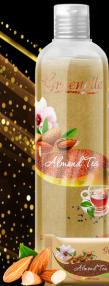
Мыло туалетное твердое «Миндальный чай»