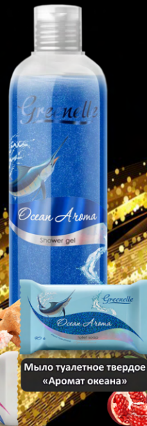
Мыло туалетное твердое «Аромат океана»