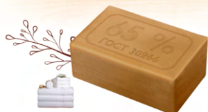
Мыло хозяйственное твердое 65%