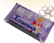
Мыло хозяйственное твердое 65% «Хозяюшка» идеальная чистота

Срок хранения 2 года с даты изготовления.