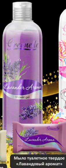
Мыло туалетное твердое «Лавандовый аромат»