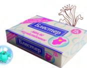
Мыло хозяйственное твердое «Блестер» для стирки детского белья

Срок хранения 2 года с даты изготовления.