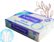
Мыло хозяйственное твердое «Блестер» для стирки белого белья