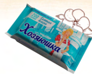
Мыло хозяйственное твердое 65% «Хозяюшка» сияющая белизна для стирки белого белья