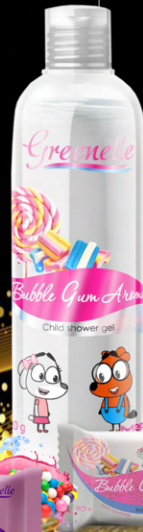
Мыло туалетное твердое детское «Бабл Гам»