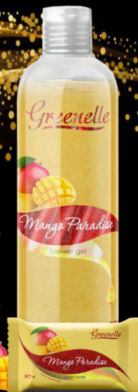
Мыло туалетное твердое «Манговый рай»