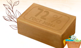
Мыло хозяйственное твердое 72%

Срок хранения 3 года с даты изготовления.