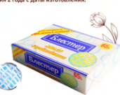
Мыло хозяйственное твердое «Блестер» для стирки и удаления пятен