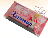
Мыло хозяйственное твердое 65% «Хозяюшка» заботливая мама для стирки детского белья