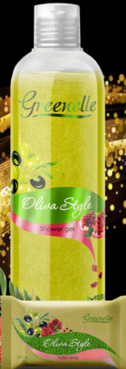
Мыло туалетное твердое «Оливковый стиль»